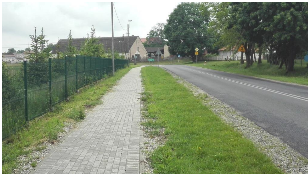
Chodnik w Osiecku