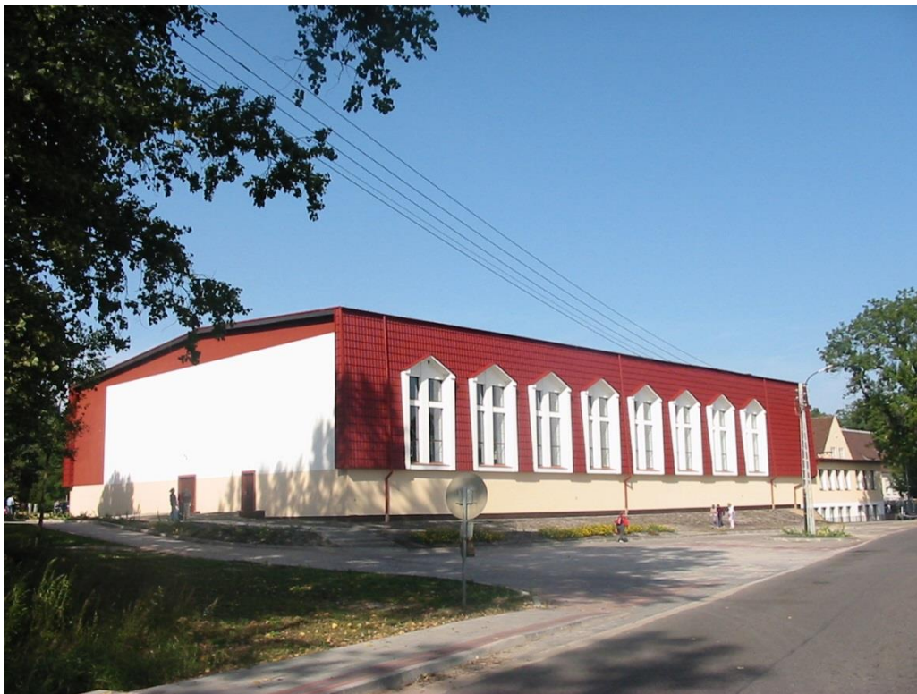
Sala sportowa przy Szkole Podstawowej w Bledzewie