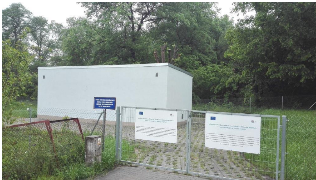
Zmodernizowany budynek stacji SUW w Starym Dworku