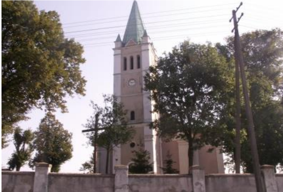
Kościół p.w. Chrystusa Króla w Templewice