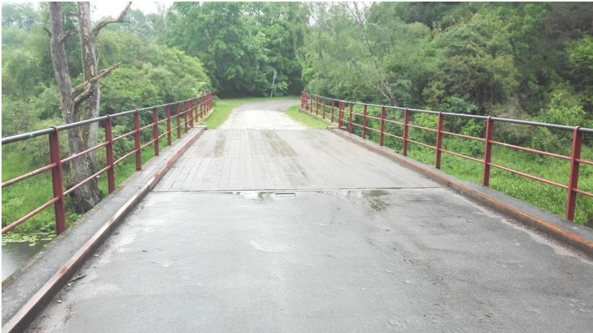
Most w Starym Dworku

5. Remont konstrukcji drewnianej mostu obrotowego w Starty Dworku, zadanie wykonane z własnych środków, koszt zadania wyniósł 18.743,89zł.