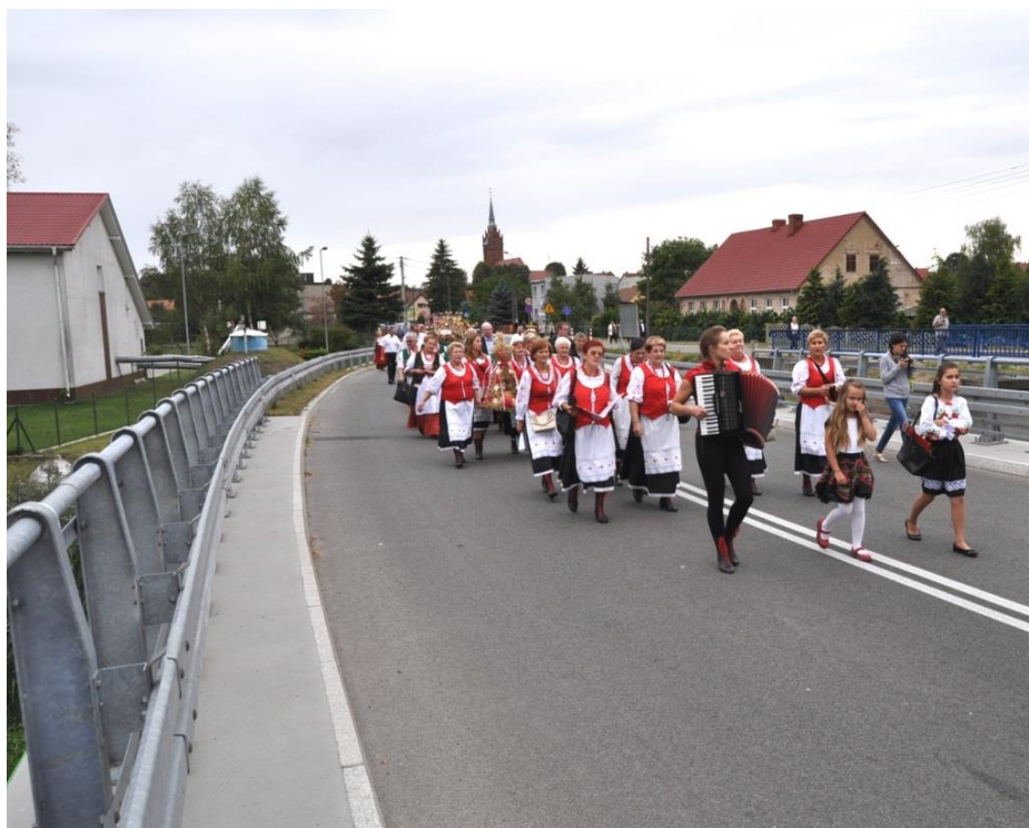
Dożynki gminne święto plonów 2018 – Korowód dożynkowy