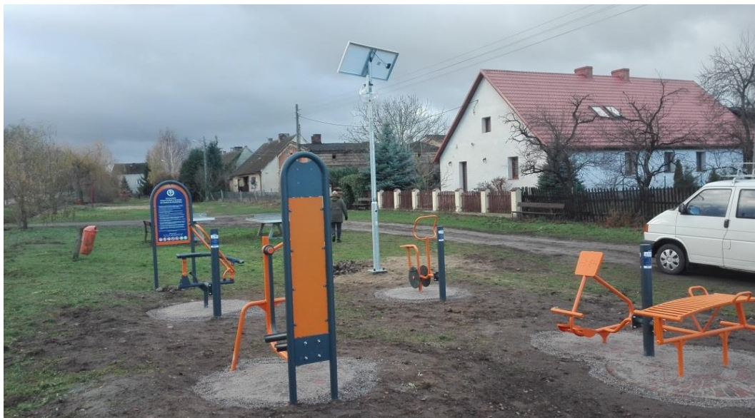
Siłownia plenerowa w Nowej Wsi