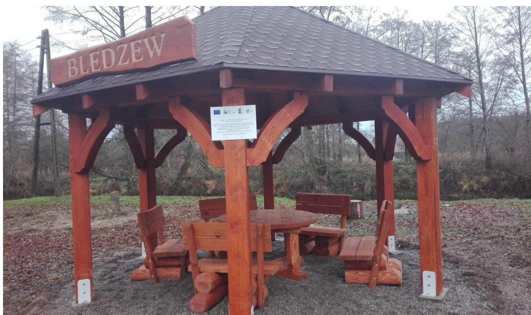
Wiata w Bledzewie