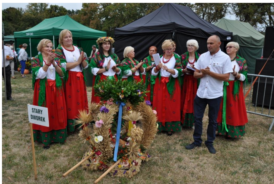
Dożynki gminne święto plonów 2018