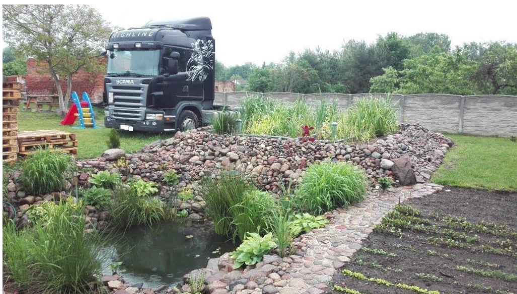
Przydomowa oczyszczalnia ścieków