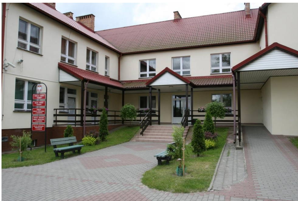
Siedziba Urzędu Gminy Bledzew

Urząd Gminy to jednostka organizacyjna, której przedmiotem działalności jest świadczenie pomocy wójtowi, w zakresie realizacji uchwał rady gminy i zadań określonych przepisami prawa. Organizację i zasady funkcjonowania urzędu gminy, określa regulamin organizacyjny, nadany przez wójta w drodze zarządzenia. Urząd Gminy realizuje zadania własne gminy oraz zadania zlecone administracji rządowej w zakresie ewidencji ludności, powszechnego obowiązku obrony cywilnej, działalności gospodarczej. Zatrudnienie według stanu na dzień 31 grudnia 2018 r. w Urzędzie Gminy Bledzew wynosiło 18 osób, w tym 1 osoba przebywa na urlopie wychowawczym i 2 osoby z obsługi. Urząd organizował roboty publiczne dla bezrobotnych z terenu Gminy Bledzew.