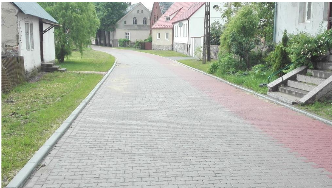
Droga w Sokolej Dąbrowie

zadanie wykonane z własnych środków, koszt zadania wyniósł 713.816,33zł