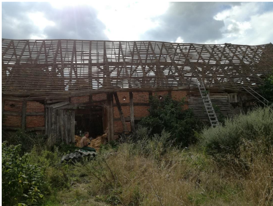
Nieruchomość w Templewie z której usunięto wyroby zawierające azbest