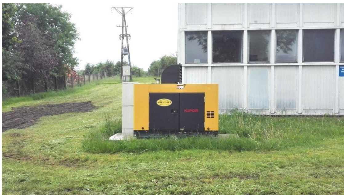
Agregat prądotwórczy na SUW w Sokoli Dąbrowie