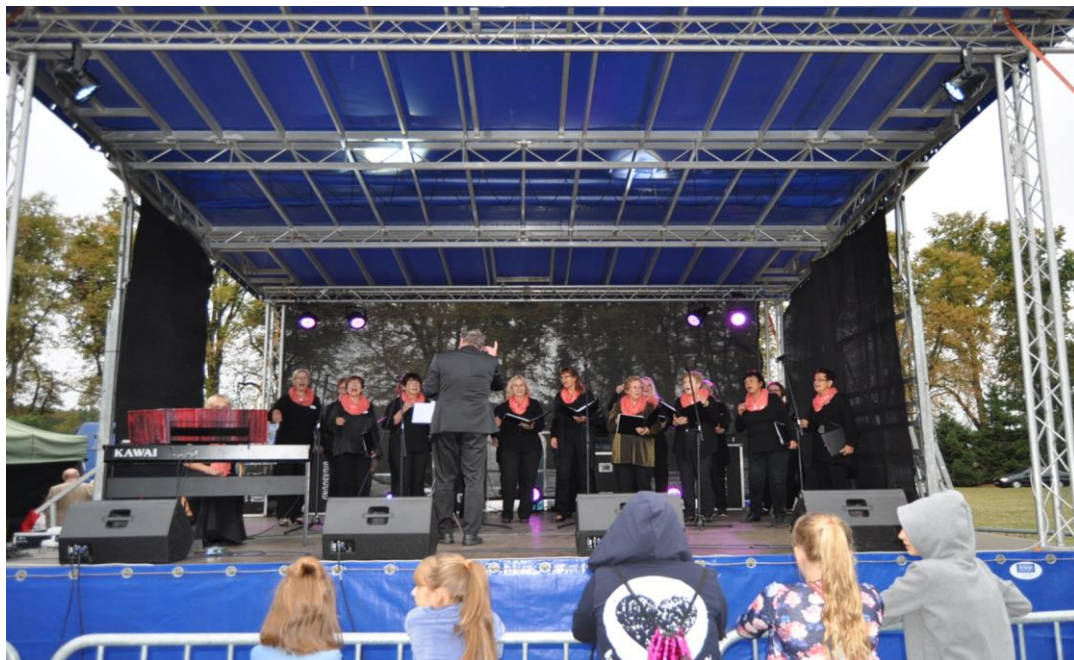
Występ chóru z Niemiec na Dożynkach Gminnych

Współpraca ta odbywa się poprzez wzajemny udział mieszkańców z terenu działania podmiotów w organizowanych imprezach sportowych i kulturalnych, co skutkuje możliwością uzyskania dofinansowania ze środków Unii Europejskiej na realizację imprez. W ubiegłym roku grupa mieszkańców Gminy Bledzew uczestniczyła w trzydniowym projekcie w Niemczech.