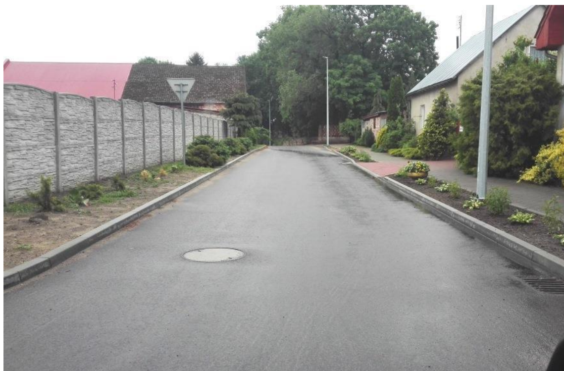
Droga w Starym Dworku

3. Zrealizowano inwestycję w zakresie przebudowy drogi w Starym Dworku, zadanie wykonane z własnych środków, koszt zadania wyniósł 610.247,68zł