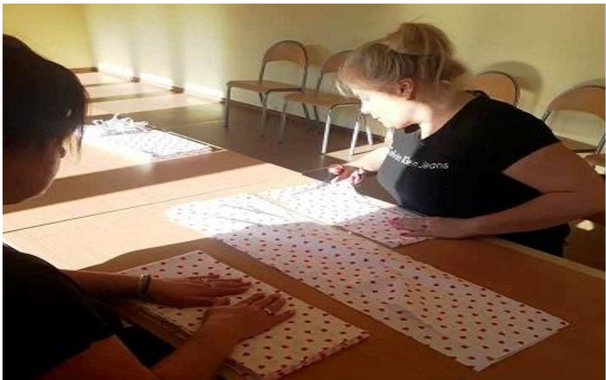
Grupa mieszkańców, która szyła maseczki dla całej naszej Gminy