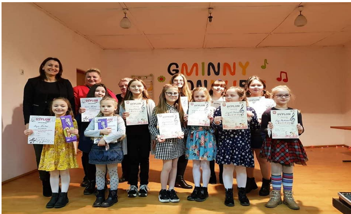
Uczestnicy i organizatorzy Gminnego konkursu recytatorskiego

W lutym odbyły się ferie zimowe dla dzieci i młodzieży, a na ich zakończenie zorganizowaliśmy wieczorek dla Babci i Dziadka. Na koniec miesiąca odbył się Gminny Konkurs Recytatorski oraz Gminny Konkurs Piosenki.