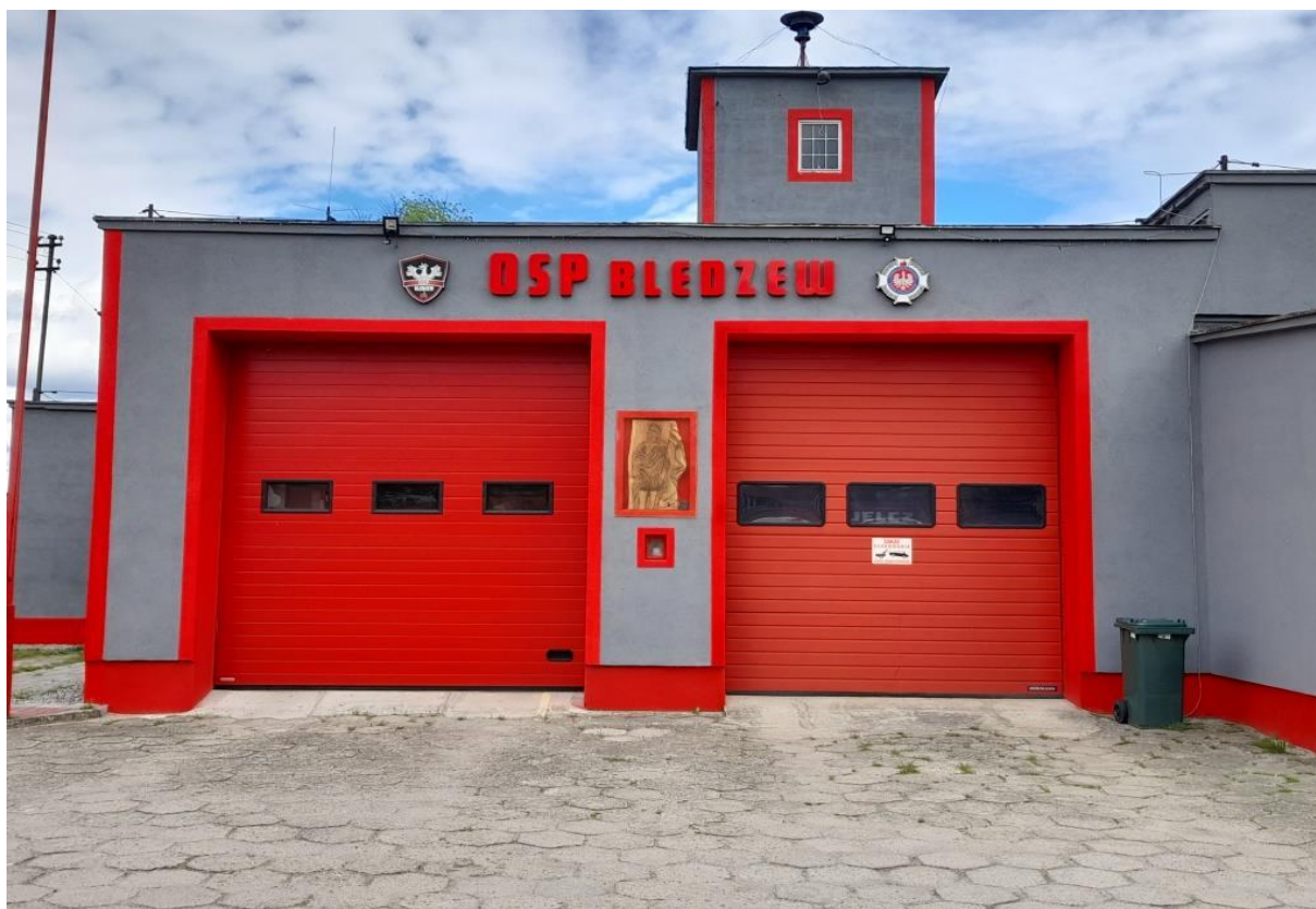
Remiza w Bledzewie