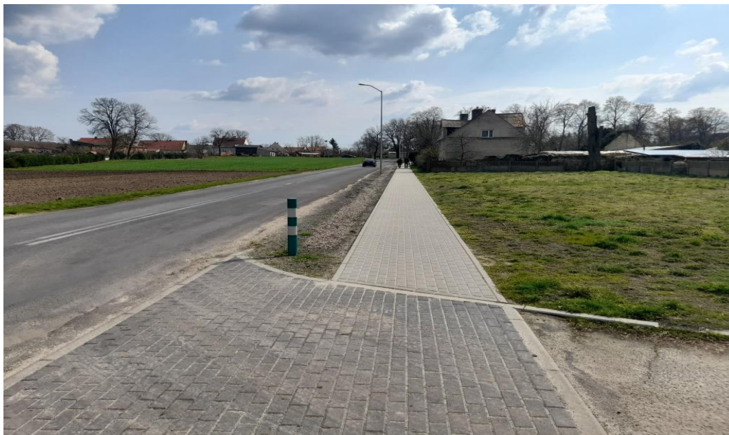
Zemsko – chodnik