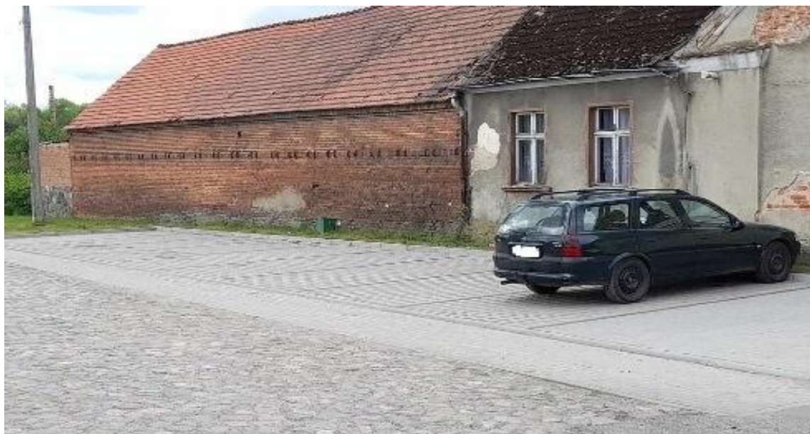
Parking w m. Osiecko