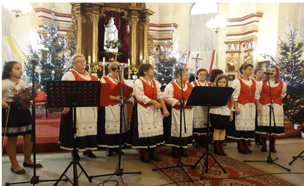
Zespół pod Kasztanem