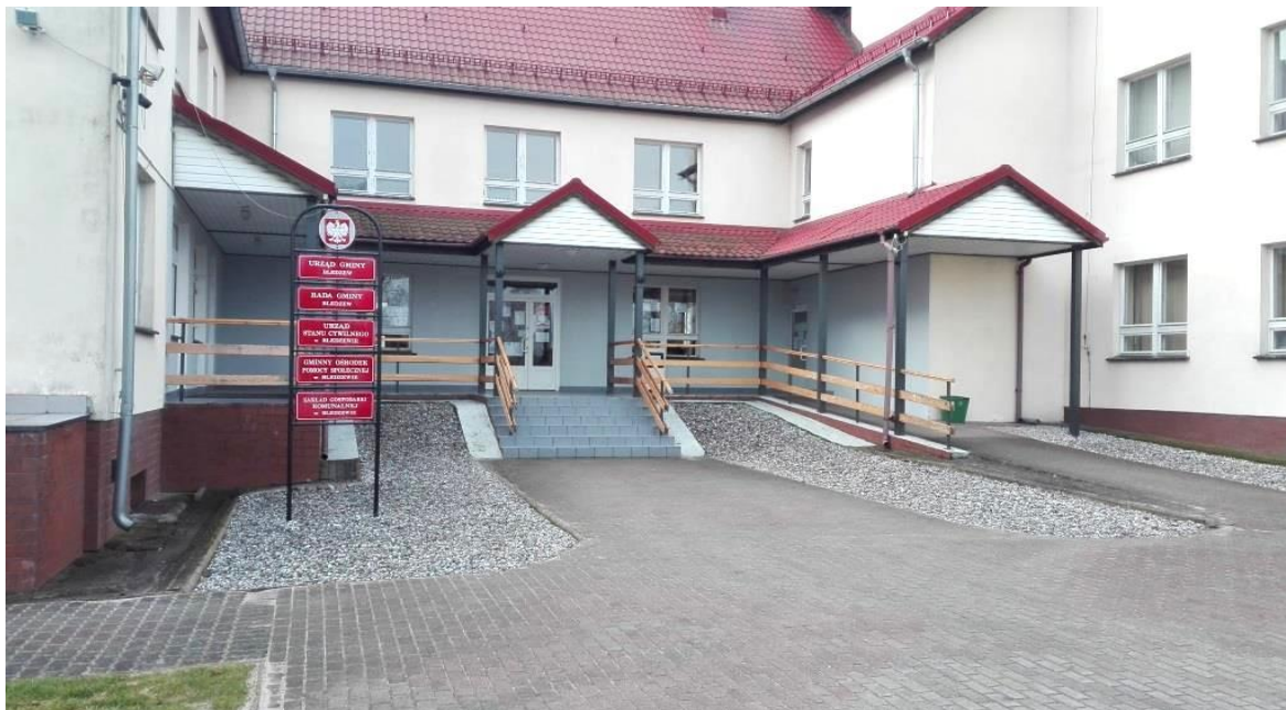
UG Bledzew – wejście główne