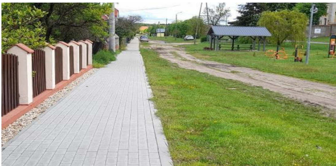
chodnik w m. Nowa Wieś