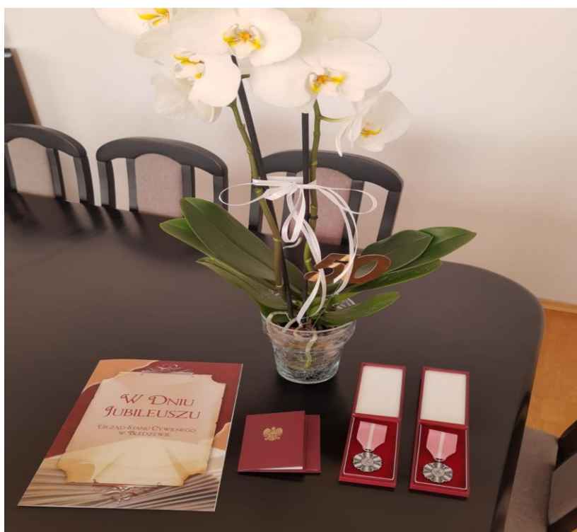
W taki sposób uhonorowani zostali nasi jubilaci

W 2020 roku obchodziło Jubileusz 50 - lecia pożycia małżeńskiego 7 par z terenu Gminy Bledzew. W związku z trwającą pandemią Jubilatów zaproszono indywidualnie na dekorację medalami do urzędu.