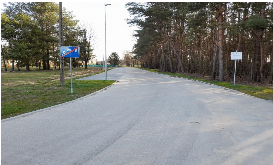
Bledzew ul. Leśna