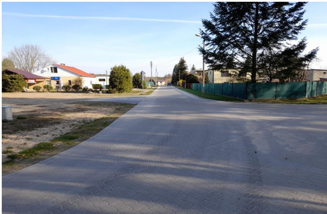
Bledzew ul. Leśna